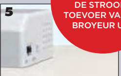
5 Zet de druschakelaar op de positie 'ON'.

SCHAKEL VÓÓR ELK ONDERHOUD DE STROOMTOEVOER VAN DE BROYEUR UIT.