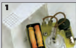
1 Plaats 2 standaardbatterijen van 1,5 V (niet meegeleverd) in de kast.