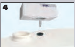
4 Plaats het SANIALARM® in de opening van het slangetje.