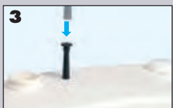
3 Breng siliconengel aan en duw vervolgens het slangetje van de druschakelaar van het SANIALARM® in het gat.