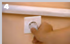
4 Schakel de stroomtoevoer van de vermaler weer in.